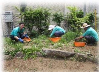
⇐公園清掃の仕事中 (皆で任された所を綺麗に)