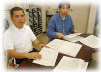
⇐事務仕事中 (運営管理から書類整理 までメンバーと一緒に)